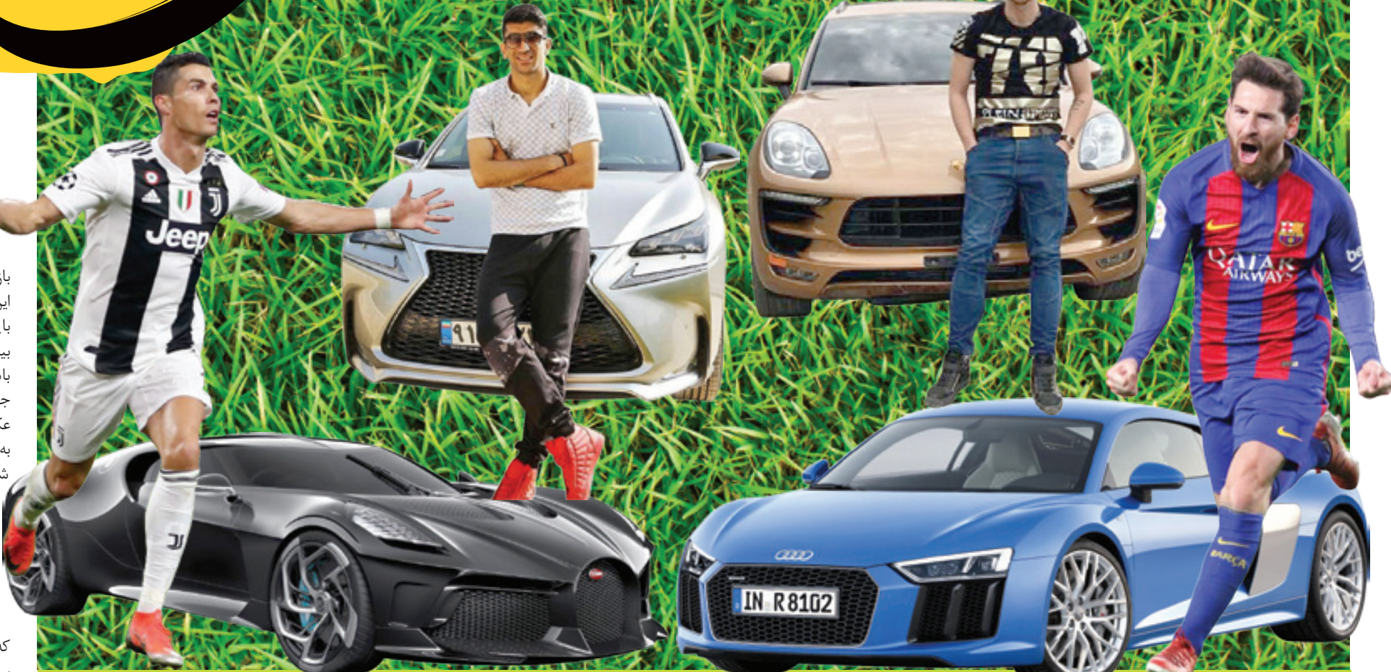
نرگس عزیزی | روزنامه نگار

«کریستیانو رونالدو» به تازگی و با خرید بوگاتی ۹/۵ میلیون پوندی (که به پول ما می‌شود تقریباً ۱۵۰ میلیارد تومان) مالک گران‌ترین خودروی جهان شده است. برای برخی قیمت بسیار بالای این چهار چرخ که ظاهر اکران‌ترین خودروی دنیاست، جالب توجه بود و برای برخی فهمیدن این که از این خودرو تنها یک نسخه ساخته شده است.