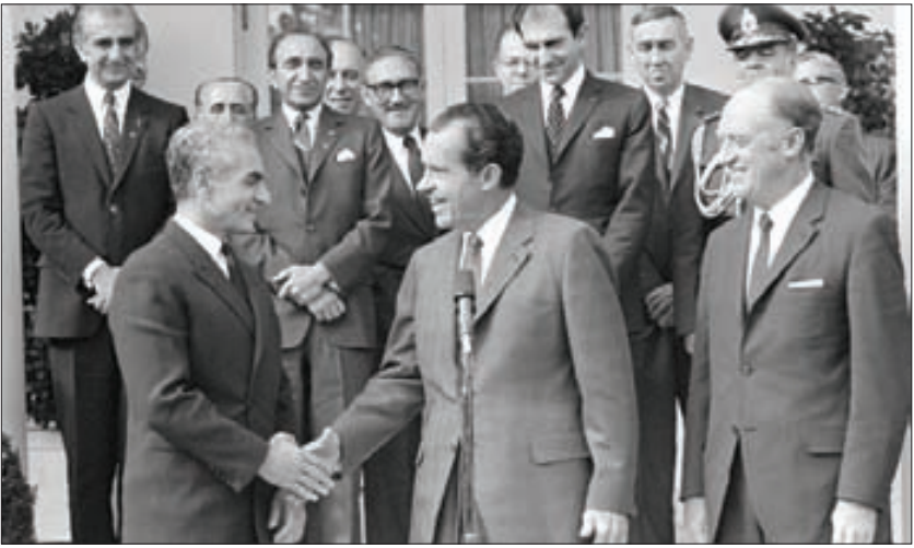
نیکسون در کنار محمد رضا پهلوی، اود تکراری افتخاری را از دانشگاهی گرفت که گوشه کنارش از خون دانشجویان مبارز رنگین بود

روز ۱۴ آذرماه سال ۱۳۳۲، «زاهدی»، اعلام کرد که روابط سیاسی با انگلیس مجدداً برقرار خواهد شد و افزود که کاردار سفارت این کشور، چند روز بعد به ایران باز خواهد گشت. هم زمان با اعلام‌های موضوع، خبرهایی مبنی بر مسافرت قریب الوقوع «نیکسون»، معاون رئیس جمهور آمریکا، نیز به گوش می رسید. «ایزن‌هاور»، رئیس جمهور آمریکا، که