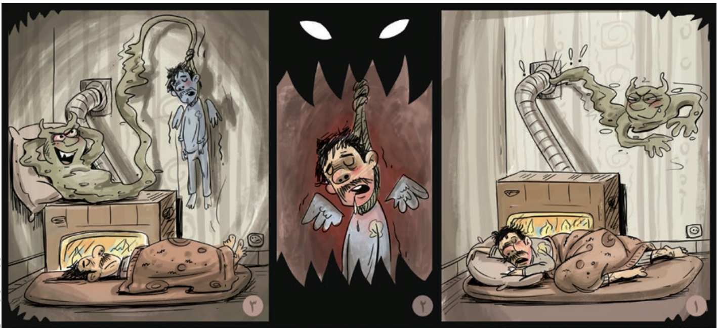
کار نویسند: زهره افشاری