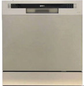
ماشین ظرف شویی رومیزی هشت نفره سام

در گروه سام نیز به مقایسه دو محصول مشابه پرداختیم و قیمت ماشین ظرف شویی رومیزی سام هشت نفره مدل DW-T1410S را با ماشین ظرف شویی رومیزی هشت نفره سامسونگ مدل MAGIC2195 مقایسه کردیم. در محصولات این شرکت هم اختلاف قیمت محسوسی مشاهده می شد. قیمت محصول سام سه میلیون و ۵۰۰ هزار تومان بود در حالی که مدل مشابه سامسونگ با قیمت پنج میلیون و ۶۰۰ هزار تومان عرضه می شود.