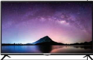
تلویزیون ۴۳ اینچی جی پلاس

تلویزیون ۴۳ اینچی جی پلاس مدل GTV-43JH512N را با مدلی تقریباً مشابه خودش در ال جی به نام تلویزیون مدل UK640043 که ۴۳ اینچی است، مقایسه کردیم که اختلاف قیمت محسوسی داشت و می شد به آن توجه کرد. قیمت تلویزیون جی پلاس سه میلیون و ۲۵۵ هزار تومان بود در حالی که مدل مشابه آن در ال جی چهار میلیون و ۵۰۰ هزار تومان بود. در بقیه محصولات هم این اختلاف قیمت را می توان دید. البته امیدواریم دلیل این اختلاف، کیفیت پایین تر محصولات نباشد.