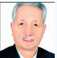
حضور آرامت در کنار ما نیست

ولی رویای مهربانی هایت همچنان همیشگی قلب ماست