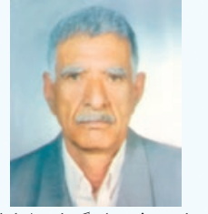
روزهای سخت دلتنگیمان را با یاد