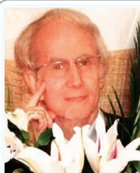
تشکر و قدردانی

بدینوسیله از کلیه فامیل و آشنایان مهربان و همسایگان گرامی