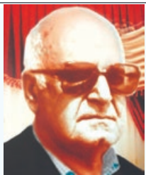
سید همین سال عروج زنده یاد پدر عزیزمان