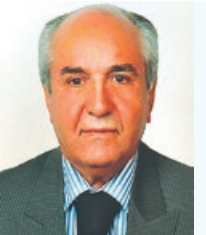
پدر عزیزمان زنده یاد