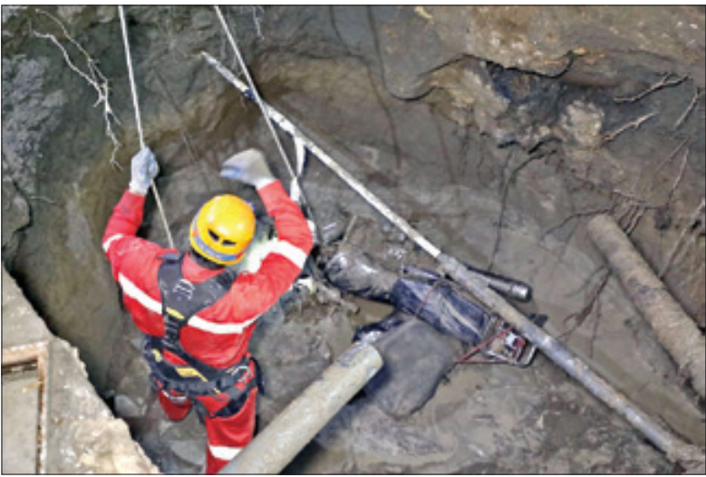
عکس ها از آتش نشانی

که در همان نزدیکی سکونت داشت. پدر برسان و مضطرب خود را به فرزند جوانش رساند و او را از «چاله وحشت» بیرون کشید. چند دقیقه بعد نیز امدادگران ایستگاه ۳ آتش نشانی از راه رسیدند و موتور سیکلت موزع جوان را در حالی از عمق زمین بیرون آوردند که مخاطبان در انتظار «روزنامه خراسان» بودند.