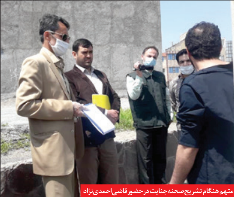
عکس ها اختصاصی خراسان

متهم هنگام تشریح صحنه جنایت در حضور قاضی احمدی نژاد