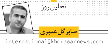
صابر گل عنبری