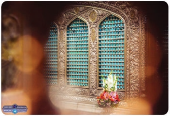
حرم امام رضا علیه السلام