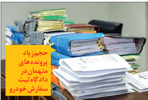
حجم زیاد پرونده های متهمان در دادگاه ثبت سفارش خودرو