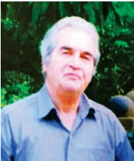
ششمین سالگرد فراق همسری مهربان