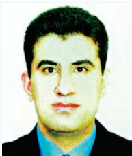
هفدهمین سالگرد فقدان فرزند دلبدمان

سرکلانتر پنجم پلیس پیشگیری پایتخت از بازداشت باند سه نفره سارقان خودرو در غرب تهران خبر داد و گفت: اتمام سوخت خودروی سرقتی، سارقان را به دام انداخت. به گزارش تسنیم، سرهنگ پیمان لطفی اظهار کرد: سه شنبه گذشته تیم عملیات کلانتری شهرک ولی عصر (عج) هنگام گشت‌زنی در محدوده خیابان حیدری به راننده و دو سر نشین یک خودرو مشکوک شدند که راننده خودروی مذکور در حال درخواست بنزین از خودروهای عبوری بود. وی با بیان این که مأموران عملیات