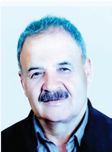
به یاد همسر و پدری مهربان

که وجودش فخر زندگیمان بود و یادش مرهم دلتنگی هایمان دو مین سالگرد درگذشت پیر غلام اهل بیت زنده یاد