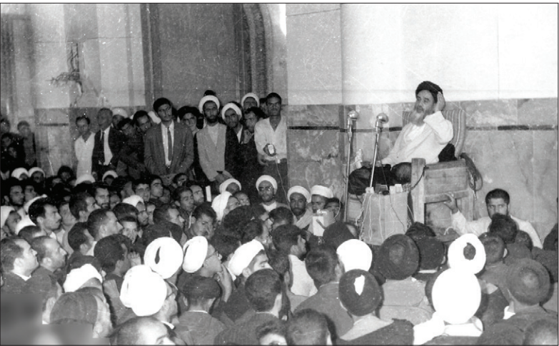
سال ۱۳۴۲ – مسجد اعظم قم؛ امام (ره) در حال افشای ماهیت رژیم برای مردم

قیام ۱۵ خرداد نسبت به حرکت‌های پیش از آن و نقش بی‌بدیل امام خمینی (ره) در جاودانگی این قیام بزرگ پرداخته‌ایم