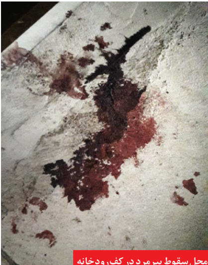
محل سقوط پیر مرد در کف رودخانه