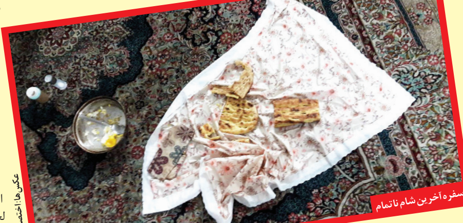
سفره آخرین شام ناتمام