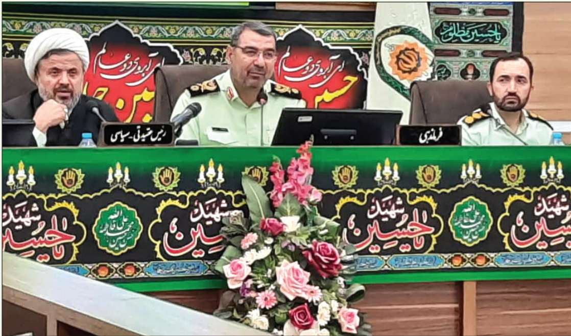
فرمانده انتظامی خراسان رضوی

دشمنان نظام برای ایجاد دو دستگی در بین شهروندان گفت: امروز هم معاندان با فراخوان های مختلف با گسترش شایعات یا حتی مطرح کردن موضوعاتی مانند «حجاب» قصد دارند به عملیات های روانی دامن بزنند و دو دستگی در بین شهروندان ایجاد کنند تا بتوانند از آب گل آلود ماهی بگیرند اما نقش پررنگ مردم در مقابله با این هدف معاندین، آن ها را سرخورده کرد.