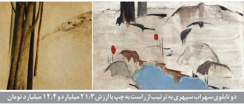
دو تابلوی سهراب سپهری به ترتیب از راست به چپ با ارزش ۲۱/۳ میلیارد و ۱۲/۴ میلیارد تومان