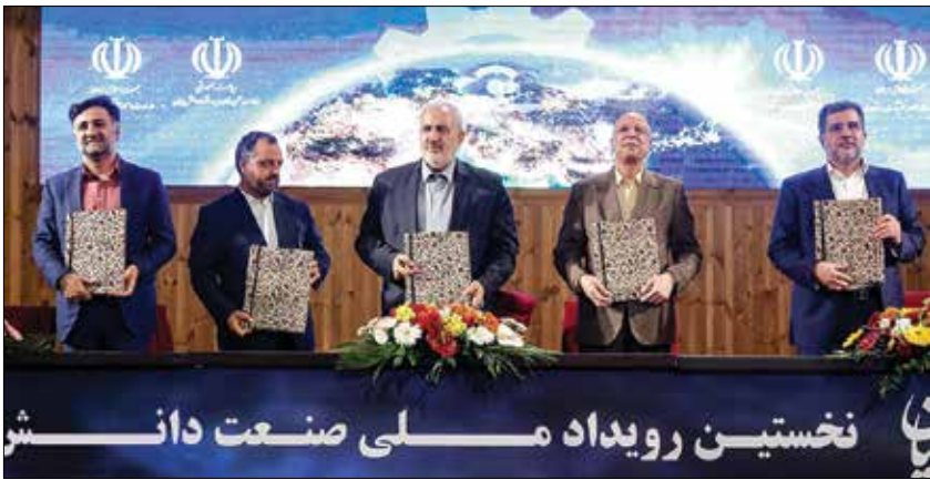
امضای تفاهم نامه ها