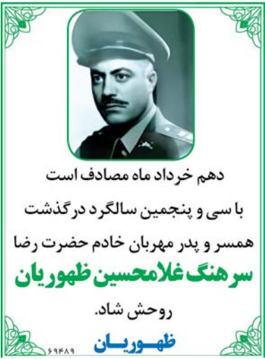
دهم خرداد ماه مصادف است