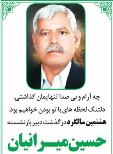
چه آرام و بی صدا تنها یمان گذاشتی.