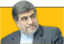
وزیر ارشاد به تماشای فیلم «سیانور» نشست