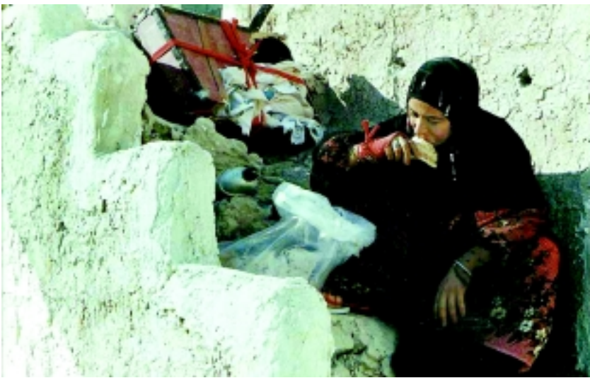
داود سلیمانی عضو کمیسیون فرهنگی مجلس: