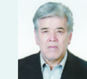
فقط او باقیست بدینوسیله در گذشت بزرگ خاندان