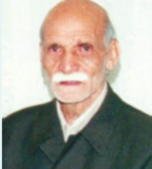
فقط او باقیست بدینوسیله در گذشت بزرگ خاندان