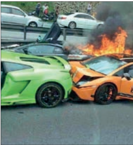
تصادف خودروهای لوکس در مالزی