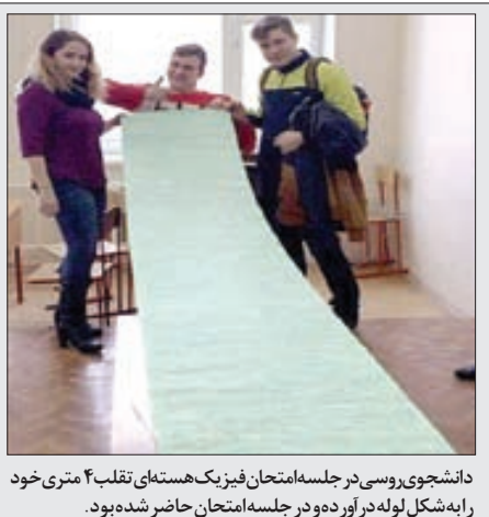
دانشجو ی روسی در جلسه امتحان یک هکستای تقلب ۴ متری خود