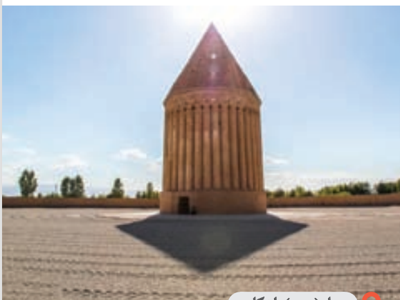
میل (برج) رادکان

روستای رادکان این روستا در فاصله ۷۵ کیلومتری مشهد واقع شده است و فاصله ای ۱۵ کیلومتری از شهرستان چناران دارد.