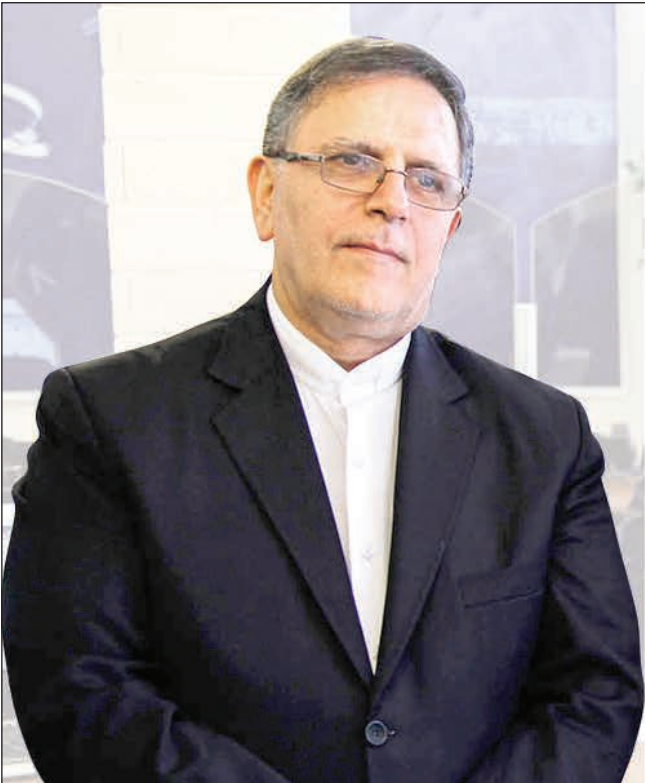
روایت سیف از گزینه های روی میز اصلاح ساختار مالی بانک ها