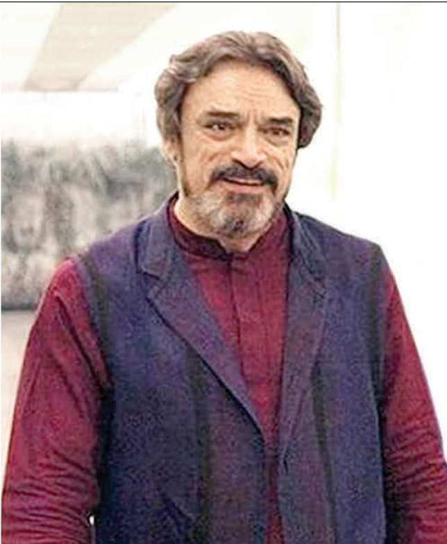
حسین علیزاده برنده جایزه موسیقی جهانی آسیا شد