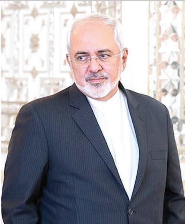
ظریف: ملتی نیستیم که بایک چشمک غربی ها بلرزیم و با چشمکی دیگر برقصیم