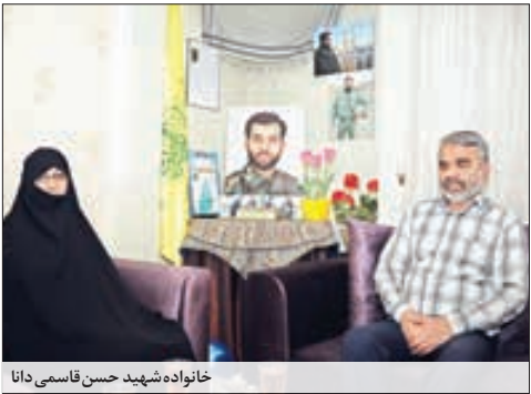
خانواده شهید حسن فاسمی دانا