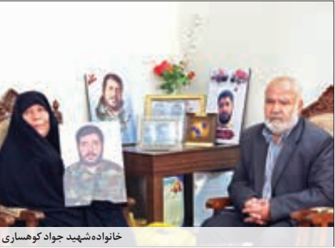
خانواده شهید جواد کوهساری