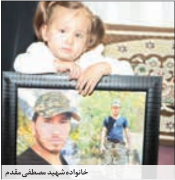
خانواده شهید مصطفی مقدم