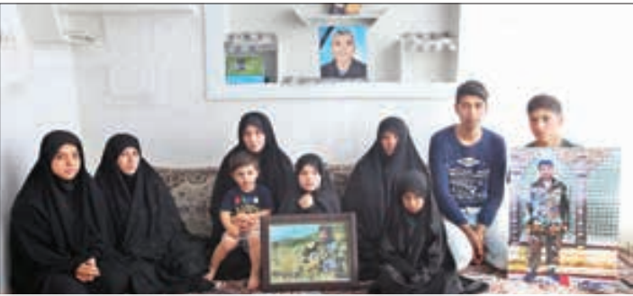
خانواده شهید سید رضا حسینی