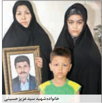
خانواده شهید سید عزیز حسینی