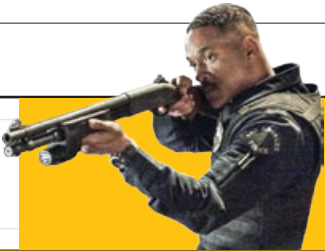
قسمت دوم «در خشان» ساخته می‌شود

مهر - به دنبال موفقیت فیلم «در خشان»، نت‌فلیکس اعلام کرد ادامه‌ای بر این فیلم می‌سازد و ویل اسمیت و جوتل ادگرتون بازیگران فیلم اصلی، نقش‌های خود را در دنباله آن نیز ادامه می‌دهند. این فیلم در سینماها اکران نشده‌و از دو هفته پیش در دسترس سرتاسر کان سرویس استریم نت فلیکس قرار گرفته است. «در خشان» تنها در سه روز نخست بیش از ۱۱ میلیون تماشاچی داشته است.