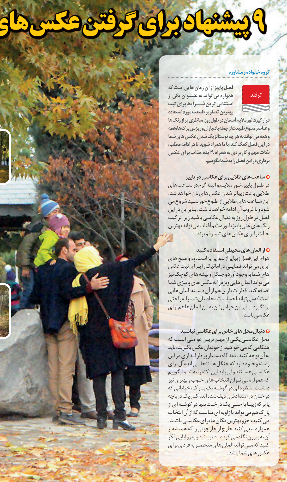
گروه خانواده و مشاوره

ترفند فصل پاییز از آن زمان‌هایی است که همواره می‌تواند به عنوان یکی از استثنای ترین شسرايط برای ثبت بهترين تصاویر طبیعت مورد استفاده قرار گیرد. نور ملایم آسمان در طول روز، مناظری پر از رنگ‌ها و عناصر متنوع طبیعت از جمله بادبان و ریزش برگ‌ها، همه و همه می‌تواند به هر چه نوستالژیک شدن عکس‌های شما در این فصل کمک کند. با ما همراه شوید تا در ادامه مطلب، نکات مهم و کاربردی به همراه ۹ ایده جذاب برای عکس برداری در این فصل را به شما بگوییم.