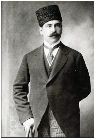
خان ملک‌ساسانی که گزارش اقدام امیرکبیر را در کتاب خود آورده است.