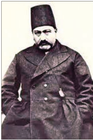
محمد حسن خان اعتماد السلطنه، روی ماجرای مکاتبات امیرکبیر و مهاراجه‌های هند

اصل گزارش مورد استفاده در متن در کتاب «سیاستگران دوره قاجار»؛ صفحه ۱۷۷