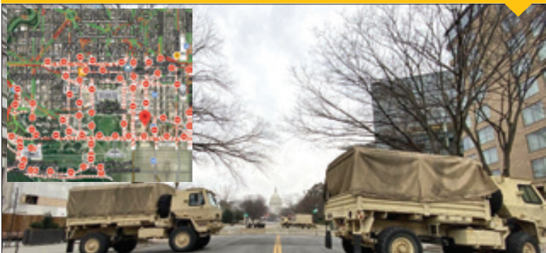
کلیه مسیرهای منتهی به اماکن حساس کنگره و کاخ سفید مسدود و بارنگ قرمز مشخص شدند

آماده باش در تمام ۵۰ ایالت آمریکا در آستانه مراسم تحلیف بایدن