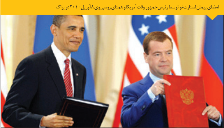
امضای پیمان استارت نو توسط رئیس‌جمهور وقت آمریکا و همتای روسی وی ۱۸ آوریل ۲۰۱۰ در پراگ

صف توزیع غذایی رایگان در نوار غزه