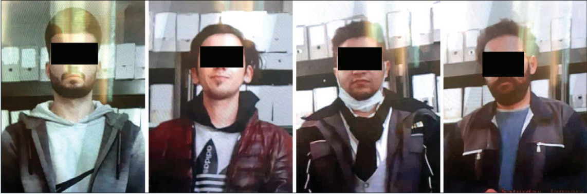
تصاویر شاکی‌ها در پرونده

سجادپور -یک باند مخوف زورگیری گوشی‌های گران قیمت، در حالی با تلاش کارآگاهان پلیس آگاهی خراسان رضوی در مشهد تلاشی شد که یکی از اعضای این باند، با دسیسه ای شوم طعمه ها را به تفرجگاه‌های می کشاندو سپس خود را نیز در معرض زورگیری همدستانش قرار می داد. رئیس پلیس آگاهی خراسان رضوی روز گذشته در گفت و گو با خراسان به تشریح ماجرای دستگیری اعضای این باند مخوف پرداخت و اظهار کرد: همزمان با اجرای طرح گسترده مبارزه با جرایم خشن در مشهد، پرونده ای در پلیس آگاهی مورد واکاوی تخصصی قرار گرفت که محتویات آن نشان می داددو جوان ۲۰ و ۲۲ساله، در تفرجگاه های اطراف بولوار طعمه زورگیران قمه به دست شده اند و دزدان موتورسوار گوشی های تلفن آنان را زورگیری کرده اند.