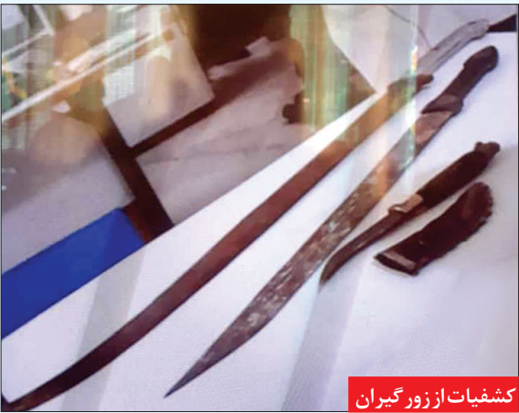
کشفیات از زورگیران

سجادپور -یک باند مخوف زورگیری گوشی‌های گران قیمت، در حالی با تلاش کارآگاهان پلیس آگاهی خراسان رضوی در مشهد تلاشی شد که یکی از اعضای این باند، با دسیسه ای شوم طعمه ها را به تفرجگاه‌های می کشاندو سپس خود را نیز در معرض زورگیری همدستانش قرار می داد. رئیس پلیس آگاهی خراسان رضوی روز گذشته در گفت و گو با خراسان به تشریح ماجرای دستگیری اعضای این باند مخوف پرداخت و اظهار کرد: همزمان با اجرای طرح گسترده مبارزه با جرایم خشن در مشهد، پرونده ای در پلیس آگاهی مورد واکاوی تخصصی قرار گرفت که محتویات آن نشان می داددو جوان ۲۰ و ۲۲ساله، در تفرجگاه های اطراف بولوار طعمه زورگیران قمه به دست شده اند و دزدان موتورسوار گوشی های تلفن آنان را زورگیری کرده اند.