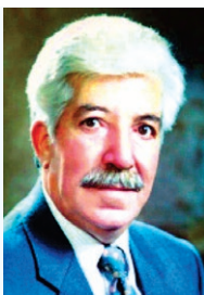
سومین سالگرد درگذشت