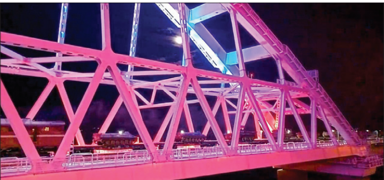
گذر سبانه ادوات زرهی از تیر و سیاه با قطار آذری پای تشنگه کرچ

یک زندان در سوئیس با انتشار فراخوان به دنبال داوطلبانی است که سه شب را در سلول بگذرانند. مقامات زندان غرب زوریخ (Gefgnis Zürich West) می‌گویند نزدیک به ۷۰۰ نفر تا کنون برای انجام این کار داوطلب شده‌اند، این در حالی است که این زندان تنها ۲۴۱ جای خالی دارد. مدیر مجموعه به داوطلبان هشدار داده که تصور نکنند این تجربه شباهتی به «اردوی تابستانی» خواهد داشت. قرار است داوطلبان بین ۲۴ تا ۲۷ مارس در این زندان به سر برند. مارک ایرمن، مدیر مجموعه بازداشتگاه، گفت: «ایده اصلی این است که مطمئن شویم زندگی روزانه می‌تواند در این سلول‌ها انجام شودو نگهبانان نیز بانحوه کار و استفاده از تجهیزات زندان آشنا شوند.» تمام وسایل الکترونیکی نظیر تلفن‌های همراه از داوطلبان گرفته خواهد شد، هر چند تفتیش بدنی برای ورود به زندان اختیاری خواهد بود. / یورونیوز