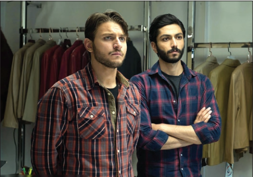
از سرنوشت ۴