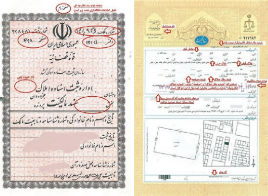
راهنمای ثبت اطلاعات ثبتی اقامتگاه اصلی خود در سندهای تکبرک و دفترچه‌ای

غیر از سرپرستان خانوار بقیه اعضای خانواده در صورتی که مالک ملکی نباشند ملزم به ثبت نام در سامانه املاک نیستند که در متن مقاله به طور کامل توضیح داده شده است.