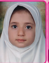
کورنظافت کلاس دوم مدرسه همت خیلی خوب