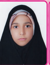
زهرافریفته کلاس دوم مدرسه گوهرشاد خیلی خوب