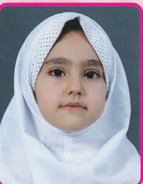
حماحگو کلاس دوم مدرسه همای خیلی خوب