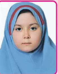
تیسیم فرجی کلاس دوم مدرسه شهید حاتمی خیلی خوب