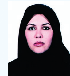
۲۴ دیماه پنجمین سالگرد