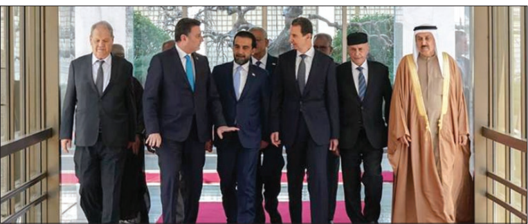
رؤسای پارلمان‌های عربی در گامی بی‌سابقه در ۱۲ سال گذشته وارد دمشق شدند و بار رئیس‌جمهور سوریه دیدار کردند

هدف حمایت از ریاست جمهوری، دولت مردم سوریه انجام شده است. این سفر در حالی انجام شده که «محمد الحلوبوسی» رئیس پارلمان عراق و رئیس فعلی اتحادیه بین المجالس عرب روز گذشته، از کشورهای عربی خواست که برای بازگشت سوریه به جمع کشورهای عربی تصمیم نهایی خود را بگیرند. گفتنی است که رؤسای پارلمان‌های قطر، کویت و مغرب از سفر به دمشق در قالب این هیئت خودداری کردند. الحلوبوسی در جریان سفر چهارمین اجلاس اتحادیه پارلمان عربی گفت: «کشورهای عربی در تمامی سطوح پارلمانی و دولتی تصمیم نهایی بازگشت سوریه به جمع کشورهای عربی را بگیرند و این کشور نقش خود را در میان کشورهای عربی، منطقه و جهان به طور مؤثر ایفا کند و برای اثبات، بازسازی زیرساخت‌ها و بازگشت عزتمندان و بازگشت برادران سوری که جنگ، آنها را از سرزمین و کشورشان کوچانده، به طور جدی تلاش شود.» ایمن صفدی، وزیر خارجه اردن هم هفته گذشته به دمشق سفر کرد و پس از آن بشار اسد و عبدالفتاح السیسی رئیس‌جمهور مصر برای اولین بار تلفنی گفت‌وگو کردند. شیخ عبدال... نیز از ایدان نهایی سفر خارجه امارات نیز یک هفته پیش در سومین سفر خود