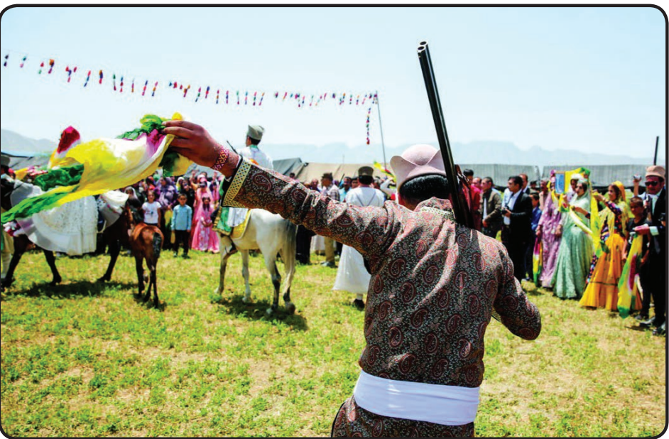
عکس هات‌ترین پستی است

البته کاربر برای یافتن اجسام مخفی باید از قبل برچسب RFID را روی آن‌ها بچسباند تا سیگنال فرکانس رادیویی بتواند آن‌ها را تشخیص دهد. در این شرایط، زمانی که فرد به شیء مدنظر خود نزدیک شود، لا به لای شفاف‌رایی هداست مشاهده می‌کند که آن شیء را نشان می‌دهد. محققان می‌گویند در آزمایش‌هایی که در انبارها انجام داده‌اند، این هداست توانسته است به‌طور میانگین اشیای مخفی را از فاصله ۹/۸ سانتی متری شناسایی کند. این دستگاه همچنین با دقت ۹۶ درصدی تایید می‌کند که کاربر اشیای در دست را برداشته است یا خیر.