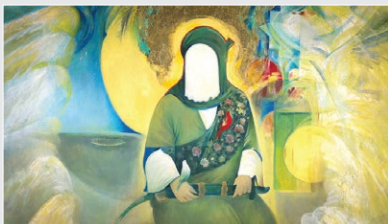
«من مرغ عشق حیدرم» اثر حبیب... صادقی