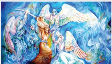
«ضربت خوردن امام علی (ع)» اثر یوسف عبدی‌نژاد