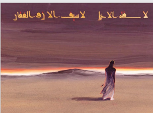
«لافتی الاعلی» اثر آیدین آغداشلو