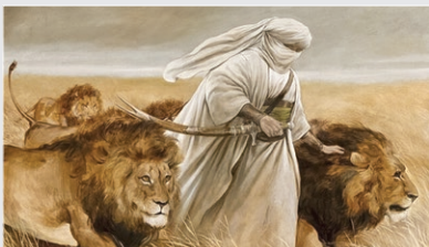
«اسدا...» اثر حسن روح‌الامین