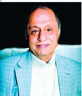
خانواده های: خواجه میرزایی- فایقی نژاد- عرب عامری- دُزی- آشفته بزدی