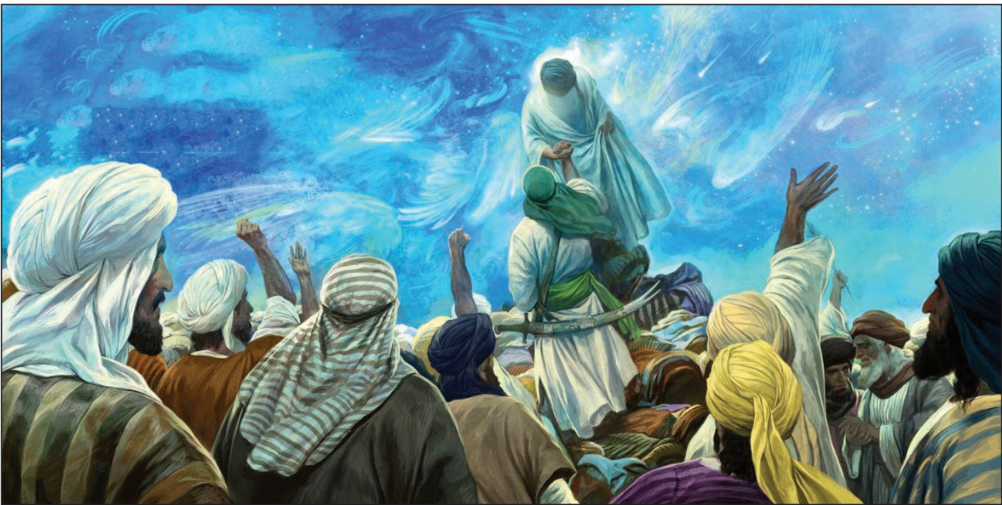
ناره نرین اثر حسن روح‌الحسین با موضوع «غدیر خم»