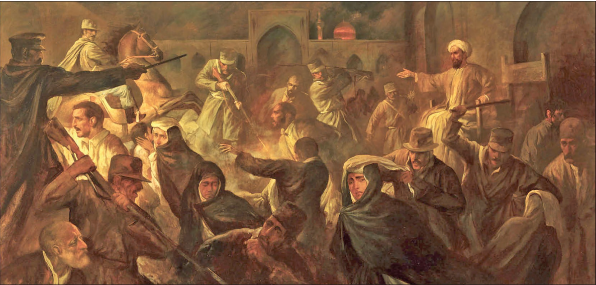
قیام گوهرشاد؛ اثر حسن روح‌الامین

قیام ۲۱ تیر سال ۱۳۱۴ که به شهادت صدها نفر از مردم مظلوم مشهد و نواحی اطراف آن انجامید، بخش اصلی و نهایی قیامی فراگیر علیه دیکتاتوری رضاشاه و سیاست‌های ضد دینی و ضد ملی او بود که با وحشیانه‌ترین شکل ممکن سر کوب شد. در این نوشتار، با رویکردی تحلیلی، به بررسی دلایل و مصادیق فراگیر بودن این قیام پرداخته‌ایم