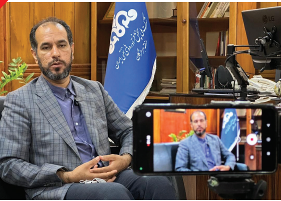
سامانه ۱۲۴ تلفن رسیدگی به شکایات وزارت صنعت معدن و تجارت تماس گرفته و موضوع را گزارش کنند.