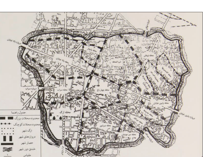
نقشه مشهد در دهه ۱۳۱۰ ش – آثار آغاز توسعه شهری بیرون از باروی شهر در این نقشه قابل مشاهده است

دست‌کم طی ۴۰۰ سال اخیر، توسعه جغرافیایی مشهد همواره در جانب غربی شهر تحقق یافته‌است و مردم، اراضی این منطقه را بیش از مناطق شرقی مرغوب دانسته‌اند؛ رویکردی که امروزه نیز، در عرصه توسعه جغرافیایی این شهر هزار و ۲۰۰ ساله به چشم می‌آید. این مسئله، دارای ریشه‌هایی تاریخی است که در نوشتار پیش‌رو، به بررسی و تحلیل آن‌ها پرداخته‌ایم