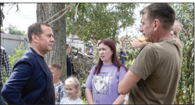
بازدیددمتری مدوف، معاون رئیس شورای امنیت روسیه از شهر توفان زده ساخالینسک روسیه