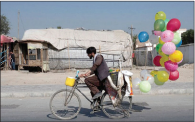
یک جوان بادکنک فروش در شهر کابل افغانستان