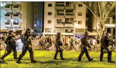
تظاهرات علیه مهاجران در قبرس