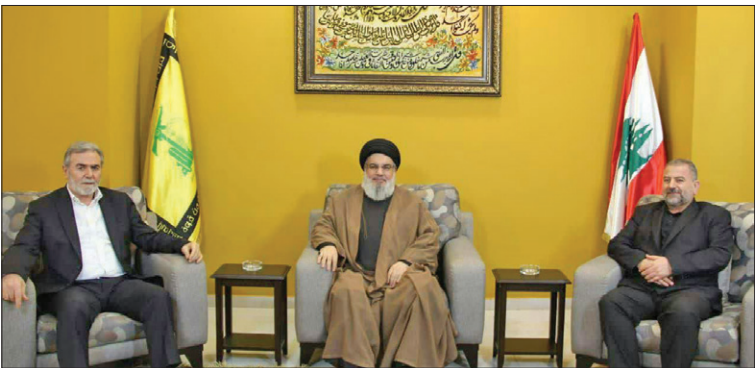
سید حسن نصرالله... این روزها میزبان دبیرکل جنبش جهاد اسلامی فلسطین و معاون دفتر سیاسی جنبش حماس در بیروت است