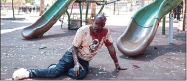
تظاهرات اعتراضی مهاجران ایترویه‌ای در شهر تل‌آویو اسرائیل / روما