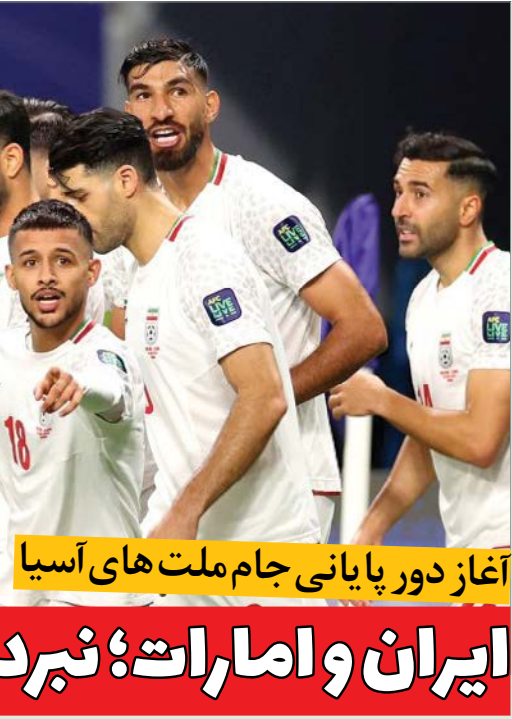
آغاز دور پایانی جام ملت‌های آسیا