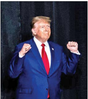
دونالد ترامپ، رئیس‌جمهور ایالات متحده آمریکا، در جریان یک سخنرانی در کاخ سفید، دست راست خود را بالا برده و مشت می‌کوبد.

مسئله مهم دیگر در ضرب الاجل حماس این است که ماه رمضان همواره آبستن تحولات زیادی در سرزمین های اشغالی بوده است و صهیونیست ها هر ساله در آستانه این ماه تدابیر امنیتی را به شدت افزایش می دهند. امسال نیز به دلیل جنگ غزه، ترس در بین صهیونیست ها دوچندان شده و از این نگران هستند که موج جنگ غزه به کرانه باختری هم سرایت کند و از وجهه مورد حمله قرار گیرند و حتی احتمال انقراض سوم رانیز پیش بینی می کنند. این نگرش وجود دارد که حماس با استفاده از فرصت ماه رمضان که برای مسلمانان اهمیت زیادی دارد، توجهات جهان اسلام را دوباره به سمت تحولات غزه بازگرداندو حاکمان سازشکار عرب را که در مقابل جنایات پنج ماهه اشغالگران سکوت اختیار کرده اند به تحرک وادارد. باتوجه به این که کشورهای غربی از جمله آمریکا هم در هفته های گذشته با مقامات تل آویوبر