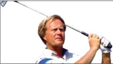
۶ جک نیکلاس ۱/۷ میلیارد دلار

بسکتبالیستی نابغه و محبوب. تنها کسی که تا حدی به مایکل جردن افسانه ای نزدیک شده. او و شکیل اونیل در کنار جردن مثلث اسطوره های این ورزش هستند. یکی از امتیازآورترین بسکتبالیست ها که ۴ بار عنوان با ارزش ترین بازیکن لیگ کشورش را تصاحب کرد. ورزشکار سال ۲۰۰۲ مجله تایم ۲ عنوان قهرمانی در المپیک و البته حضوری ناموفق در یک فیلم سینمایی گیشه ای. فیلمی که گوشه ای از ثروت و خانه واقعی او را هم نشان داد. جیمز ۱/۳۶ میلیارد دلار درآمد خالص داشته که تا ۱/۷ میلیارد دلار معادل سازی می شود.