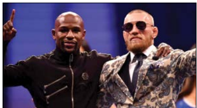
۱۰ فلویید میو در ۱/۴۸ میلیارد دلار

تنیسوری خوش تیپ و بی نظیر. محبوب ترین تنیسور تاریخ. کاریزماتیک و افسانه ای. حتی اگر طرفدار این ورزش هم نباشید اسم و چهره او را می شناسید. کسی که ۱/۱ میلیارد دلار درآمد کسب کرد که با احتساب شاخص های تورمی معادل ۱/۴۹ میلیارد دلار امروز است تا با فاصله کمی بعد از یکام نفر نهم این فهرست باشد.