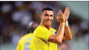
۳ کریس رونالدو ۱/۹ میلیارد دلار

یک درآمد شگفت انگیز برای مردی پر حاشیه و عجیب که خیلی از علاقه مندان به ورزش در گوشه و کنار دنیا نامش را هم اندازه یک فوتبالیست معمولی ننشیده اند.