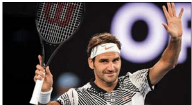
۹ راجر فدرر ۱/۴۹ میلیارد دلار

به دست آورد. حضور او در آگهی های معروف قدیمی مثل گلا دیاتور ها با انتقاد مربانش همراه بود. اما او هیچ وقت از این فضا فاصله نگرفت.