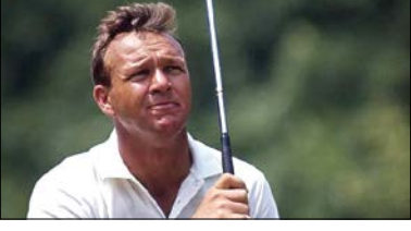
۴ آنولد پالمر ۱/۷۶ میلیارد دلار

نیازی به معرفی ندار، نابغه خوش تیپ فوتبال، رقیب همیشگی مسی. کریس هر چه قدر در دنیای فوتبال از رکوردها و عناوین مسی عقب افتاده به خاطر تیپ کاریزماتیک و حضور موفق تر در عرصه تبلیغات در زمینه درآمدزایی موفق تر ظاهر شده و درآمدش حدود ۳۰۰ میلیون دلار از مسی بالاتر است. هر چند مسی ۲ سال کوچک تر است و فرصت بیشتری برای افزایش درآمد در زندگی حرفه ای و ورزشی دارد. بد نیست بدانید اصل درآمد کریس ۱/۶ میلیارد دلار بوده که متناسب با زمان طولانی عمر ورزشی او یعنی دو دهه، براساس تورم معادل ۱/۹۲ میلیارد دلار امروز برآورده شده است.