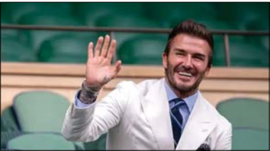
۸ دیوید یکام ۱/۵ میلیارد دلار

مسی بعد از مشکلاتی که حین قراردادش با بارسا پیش آمد با پیشنهادی یک میلیارد دلاری از السد مواجه شد اما به پاری سن ژرمن رفت. پیشنهادی که اگر می پذیرفت شرایط او را در این فهرست متحول می کرد. اما بعد از خداحافظی از پاریس هم با پیشنهاد سنگینی از الهلال مواجه شد اما به خاطر خانواده اش به اینتر میامی رفت تا در تیمی به مدیریت یکام فعالیت کند. او در کنار کریس رونالدو تنها کسانی هستند که هنوز می توانند از ورزش درآمد داشته باشند. درآمد خالص مسی ۱/۳۶ میلیارد دلار معادل ۱/۶۷ میلیارد دلار امروز برآورده شده است.