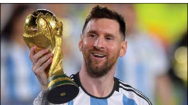
۷ لیونل مسی ۱/۶۷ میلیارد دلار

درآمد کمتر نفر ششم شده. نیکلاس ۸۹۰ میلیون دلار درآمد داشته که متناسب با تورم به پول امروز به اندازه ۱/۷ میلیارد دلار برآورده شده است.