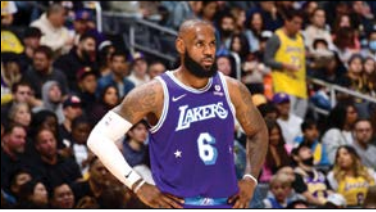
۵ لبران جیمز ۱/۷ میلیارد دلار

تعدیل شده است. تصور کنید این گلف باز قدیمی اگر با این حجم از نبوغ و عناوین امروز ورزشکار حرفه ای بود از آگهی های تبلیغاتی چه درآمد نجومی می توانست داشته باشد.