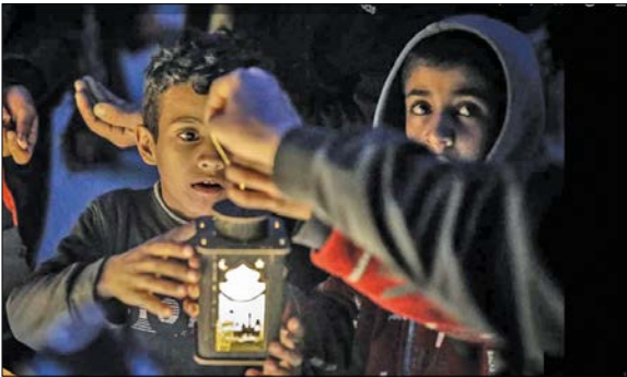
چهارشنبه ۲۳ اسفند ۱۴۰۲، شماره ۲۱۴۵۳ ۲۱۴۵۳ و ۱۳ مارس ۲۰۲۴